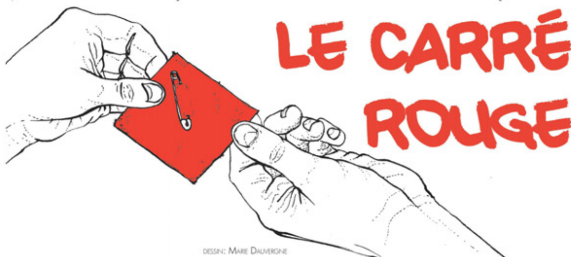
DESSIN: MARE DAUVERGNE

Depuis la grève générale étudiante de 2005, le carré rouge fut adopté par les étudiants et les étudiantes et est devenu un symbole de leur solidarité dans leur opposition aux coupures du gouvernement Charest dans les prêts et bourses. Sensé représenter le fait que les étudiantes et étudiants étaient « carrément dans le rouge », ce symbole continue encore d'être porté par ceux et celles qui appuient les luttes étudiantes.